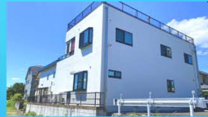
「アトムレジーナKH-1工法」による遮熱断熱塗装 伸縮性に優れひび割れに強く、W反射により赤外線から建物を守ります